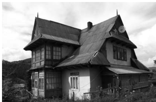
Il. 5. Worochta, pensjonat Krakowianka, 2009 r.