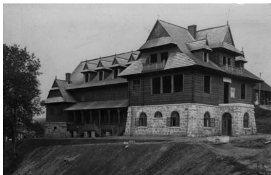
Il. 4. Worochta, Dom Ludowy w trakcie budowy, 1929 r., fot.: Adolf Błaż, proj.: Kajetan Petrowicz (?), ok. 1926 r. (Narodowe Archiwum Cyfrowe, sygn. 3/1/0/10/3968/1)

realizacji dopełniają podhalańskie detale – motywy wschodzącego słońca w szczytach, zakopiańskie wyględy oraz pazdury . Podobne cechy występują w także niezachowanym budynku dawnego pensjonatu Renatka w Tatarowie (il. 2) 11 . W tym przypadku do katalogu motywów zakopiańskich dołącza zdecydowanie podhalańska kompozycja szczytów z dwoma daszkami okapowymi ( strzeszkami ) i kozubami . Nie udało się odnaleźć innego obiektu powstałego przed I wojną światową, który reprezentowałby zakopiańszczyznę w tym regionie w sposób pełniejszy niż powyżej opisane budynki.