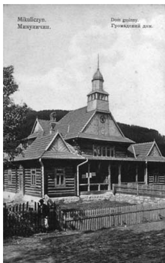
Il. 1. Mikuliczyn, Dom Gminny, projekt: Tadeusz Obmiński, ok. 1903 r., pocztówka z ok. 1925 r. (Biblioteka Narodowa, sygn.: Poczt. 16412)

Motywy zakopiańskie można zidentyfikować w bardzo niewielkiej liczbie obiektów. Budynek reprezentujący styl zakopiański w jego pełnej lub zbliżonej do niego postaci nigdy nie powstał na Huculszczyźnie. Spotkać natomiast można realizacje posługujące się wybranymi elementami rodem z Podhala. Zidentyfikować je można zarówno na elewacjach, jak i we wnętrzach obiektów. Powstawały one od początku XX w.; do dnia dzisiejszego zachowały się jedynie budynki powstałe w okresie międzywojennym. Należy zauważyć, że znany jest reprezentatywny, lecz niepełny ich zasób, co jest skutkiem zniszczeń powstałych w trakcie obu wojen światowych i niekompletności źródeł archiwalnych.