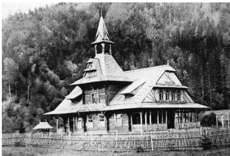
Il. 2. Tatarów, pensjonat Renatka (później Liljana), przed 1914 r., fot. w zbiorach autora