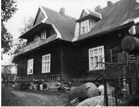
Il. 8. Worochta, pensjonat Mimoza, 2009 r.