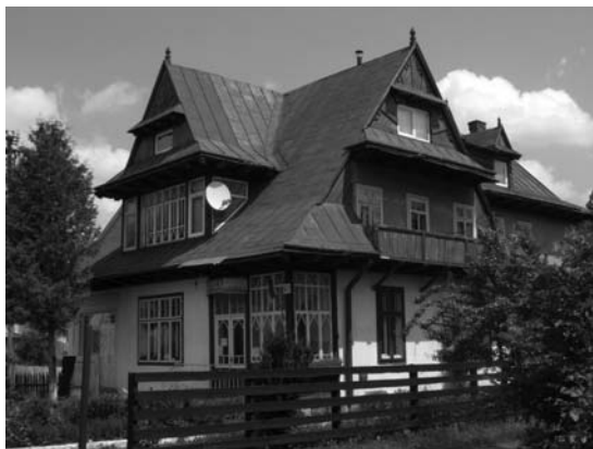
Il. 6. Worochta, pensjonat o nieznanym nazwie z apteką, 2009 r.