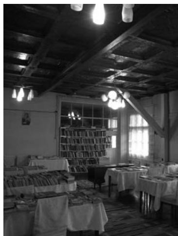
Il. 10. Worochta, pensjonat Liliana, wnętrze dawnej jadalni ze stropem kasetonowym, parter, 2009 r.

Pensjonat Liljana w Worochcie powstał najprawdopodobniej w drugiej połowie lat 30. XX w., a jego projektant jest nieznany. W sali jadalnianej tego obiektu zachowała się boazeria oraz belkowy strop kasetonowy z bogatą dekoracją geometryczną i roślinną o regionalnych motywach huculskich i zakopiańskich (il. 10 i 11) 16 . Ornamentyka występuje na profilowanych belkach stropowych, a także w polach kasetonów. Na podniebieniach belek umieszczono kryształowo cięte romby i trójkąty z ukośną kratką – mirwą . Rozety w postaci sześciodzielnego kwiatu w otoku zajmują miejsca na przecięciu się belek. Pola kasetonów wypełniają wygięte gałązki z podłużnymi liśćmi – gaje . Otaczają one centralnie usytuowane sześciodzielne kwiaty – gwiazdy . Podobny w strukturze, lecz różniący się detalami strop kasetonowy występuje w pomieszczeniu dawnej apteki we wspomnianym wcześniej pensjonacie w Worochcie (il. 12). Także tutaj nastąpiło przemieszanie się ornamentów zakopiańskich z huculskimi.