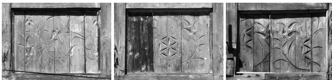
Il. 13, 14, 15, 16. Worochta, pensjonat Lena, płyciny balustrady galerii pierwszego piętra w elewacji frontowej, 2012 r., fot.: J. Czubiński