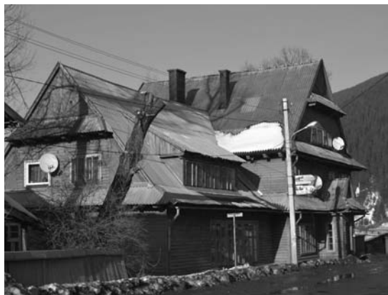
Il. 7. Worochta, pensjonat Nad Prutem, 2012 r.

Cechy architektury Podhala rozpoznać można także w kilku niedużych kubaturach obiektach pensjonatowych. Nieznane są nazwiska ich projektantów. Budynki te cechują relatywnie prosta kompozycja całości bryły, podobny kąt nachylenia stromych dachów, stosowanie daszków okapowych oraz występowanie motywu wschodzącego słońca w szczytach. Spotykane są pazdury , sporadycznie pojawiają się wyględy .