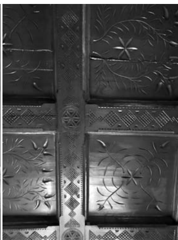
Il. 11. Worochta, pensjonat Liliana, parter, fragment stropu kasetonowego w dawnej jadalni, 2019 r.