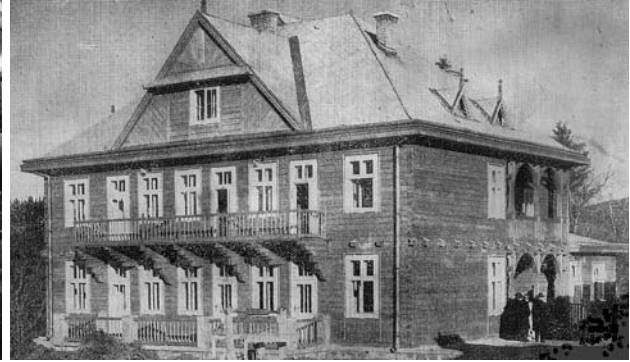
Il. 9. Mikuliczyn, Sanatorium Akademików Lwowskich, proj.: Andrzej Kapłoński i Czesław Müller, ok. 1925 r. (W trosce o zdrowie młodzieży akademickiej, „Wielkopolska Ilustracja” 1928, nr 11, s. 7)

Powyższe przykłady reprezentują relatywnie złożone kompozycje, w których można rozpoznać detale zapożyczone z ludowej architektury Podhala. Istnieje cała grupa obiektów, w których zidentyfikować można jedynie pojedynczy element o często uproszczonej zakopiańskiej stylistyce. Najczęściej spotykaną kompozycją identyfikującą wpływy z Zakopanego jest trójkątny szczyt budynku, ryzalitu lub facjaty z daszkami okapowymi i motywem wschodzącego słońca . Reprezentatywnym przykładem takiego rozwiązania był zniszczony w trakcie II wojny światowej drewniany budynek Sanatorium Akademików Lwowskich w Mikuliczynie (il. 9). Interesujący obiekt powstał w latach 1925–1928 według projektu architektów lwowskich Aleksandra Kapłońskiego (1884–1943) i Czesława Müllera (daty życia nieznane) jako część większego założenia składającego się z dwóch budynków. Całość ukończono w 1934 r. 15 Stromy szczyt ze wschodzącym słońcem ponad niewielkim daszkiem okapowym oraz pazdury są jedynymi elementami nawiązującymi do stylistyki podhalańskiej. Prosta, prostopadłościenna bryła całości budynku wyróżnia się narożną dwukondygnacyjną loggią oraz długim balkonem w elewacji frontowej podtrzymywanym przez solidne belkowe, uskokowe wsporniki. Elementy te przywołują skojarzenie ze stylem huculskim.