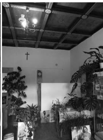
Il. 12. Worochta, pensjonat o nieznanym nazwie z apteką, wnętrze dawnego pomieszczenia aptecznego ze stropem kasetonowym, 2009 r.

Interesujący, lecz niestety niezachowany detal architektoniczny z motywami dekoracji opartej na wzorcach podhalańskich występował w elewacji pensjonatu Lena w Worochcie. Ten powstały jeszcze przed I wojną światową budynek odznaczał się wielością galerii i werand zlokalizowanych na wszystkich elewacjach i na każdej z trzech kondygnacji. Całość utrzymana była w stylistyce huculskiej. Płyciny balustrady galerii pierwszego piętra nad głównym wejściem w elewacji frontowej były od lat 20. poprzedniego wieku wypełnione płaskorzeźbionymi panelami z motywami roślinnymi i geometrycznymi (il. 13, 14, 15, 16). Analiza użytych ornamentów pozwala wyróżnić m.in. takie