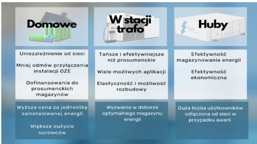
Rysunek 4. Typy magazynów energii