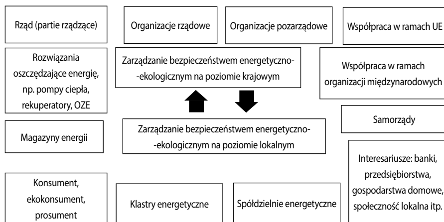
Rysunek 1. Zarządzanie bezpieczeństwem na poziomie krajowym i lokalnym – wielość elementów składowych