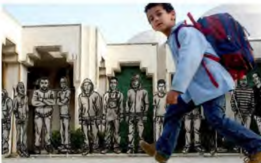
Element instalacji „Les-Martyrs” 33

Na powyższych przykładach widać wyraźnie, że street art nie tylko odegrał istotną rolę w Arabskiej Wiośnie, ale stał się wręcz jej integralną częścią. Z drugiej strony można powiedzieć, że i Arabska Wiosna przyniosła korzyści street artowi na Bliskim Wschodzie. Gdyby bowiem nie nagle przebudzenie i bunt społeczny, sztuka uliczna na Bliskim Wschodzie jeszcze długo tkwiłaby w podziemiu.