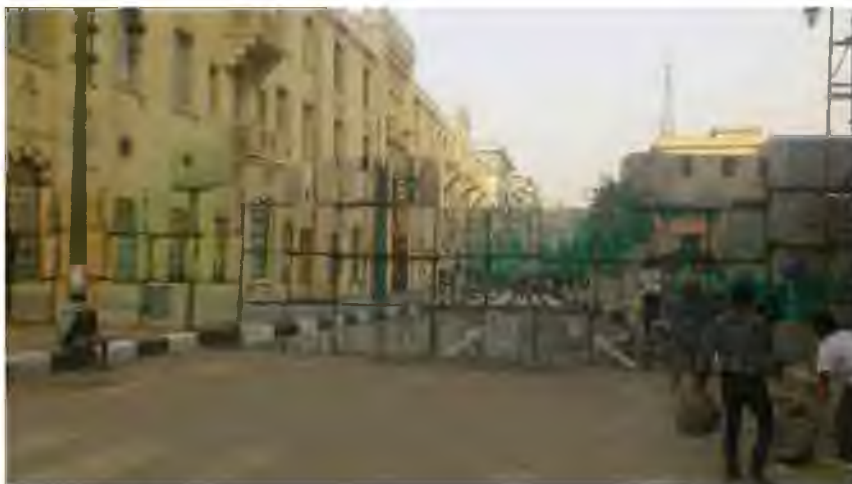
„Ulica bez muru” 32