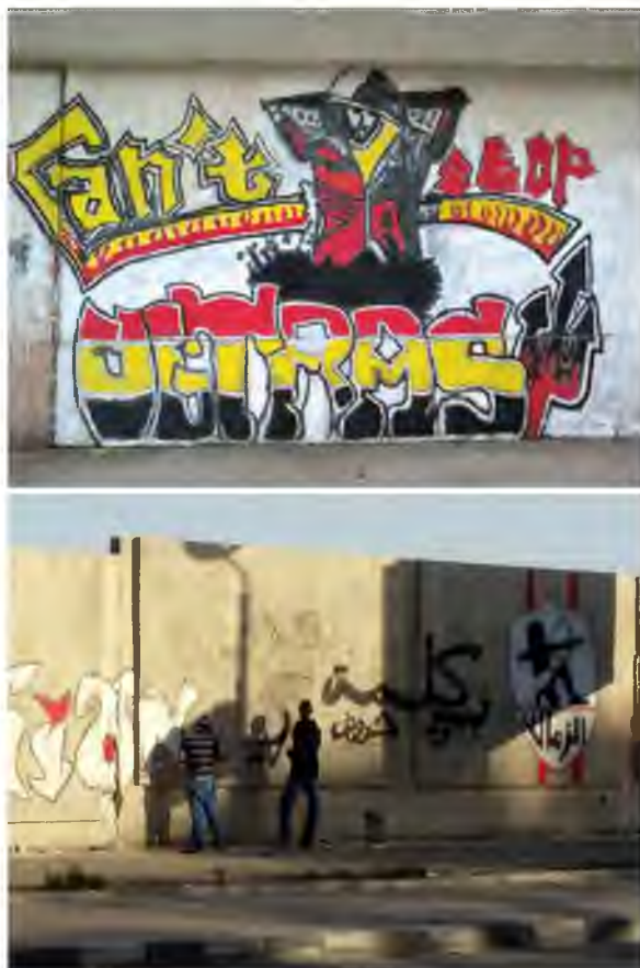
Graffiti piłkarskie z Tunezji 23 oraz egipscy kibice malujący na murze 24

Błędem byłoby jednak stwierdzenie, że świadome polityczne i społeczne graffiti nie istniało na Bliskim Wschodzie przed rokiem 2011, choć to właśnie Arabska Wiosna stała się zapalnikiem w nagłej eksplozji graffiti jako broni w rękach społeczeństwa, w na pozór nierównej walce pomiędzy obywatelami a władzą. Wtedy bowiem graffiti zaczęło być używane świadomie – użycie farby na ścianie miało wypełnić określone społeczne przesłanie. Był to więc okres przelomowy w historii nie tylko Bliskiego Wschodu, ale i całej historii graffiti na świecie. Z punktu widzenia dużej części egipskiego społeczeństwa graffiti było nową, nieznaną wcześniej formą sztuki. Użyto jej w celu prostego i łatwego przekazania idei i przekonań, bez żonglowania polityczną terminologią, która byłaby zbyt trudna do zrozumienia dla rzesz niewykształconej egipskiej biedoty 25 .