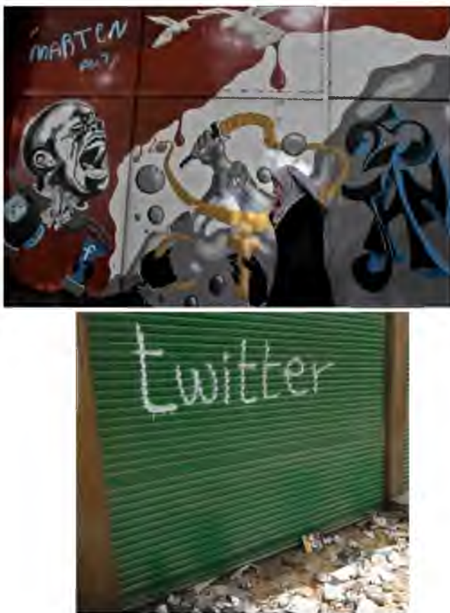
Mural upamiętniający wydarzenia 25 stycznia w Kairze i napis „Twitter” na witrynie sklepu niedaleko placu Tahrir

W czasach Husniego Mubaraka graffiti na murach Kairu pojawiały się w znikomej liczbie, kiedy jednak protesty antyrządowe przybrały na sile, zjawisko wręcz eksplodowało. Symboliczne opanowanie ulic było bardzo istotne dla protestujących. Zjawisko to przyrównać można do prymitywnego oznaczania swojego terytorium przez dzikie plemiona. Chodziło bowiem o nieświadome stworzenie środowiska przyjaznego protestującym, wychodzący na ulice ludzie mogli obserwować pojawiające się nowe napisy i hasła atakujące rząd – czuli więc, że są otoczeni nie przez siły bezpieczeństwa, ale przez ludzi o takich samych poglądach, którzy maszerują obok nich w tym samym celu. Wytworzyło się poczucie jedności i względnego bezpieczeństwa. Ponadto nigdy wcześniej nie zaobserwowano bowiem tak błyskawicznej ewolucji sztuki ulicznej w tak krótkim czasie. Nie chodzi tu tylko o ilość pojawiających się na ulicach hasel, ale również o błyskawiczny rozwój form wyrazu i wykorzystywanych technik.