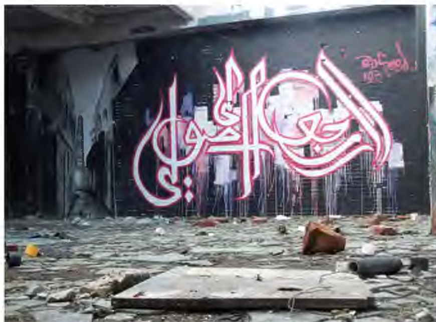
Graffiti inspirowane klasyczną kaligrafią arabską 17

Wraz z wkraczaniem na tereny Bliskiego Wschodu subkultury hip-hopowej w późnych latach 80. XX w. można obserwować rozkwit street artu. Coraz częściej zobaczyć można nowatorskie formy graffiti zdobiące mury takich miast, jak Bejrut, Bagdad czy Jerozolima. Street art czerpie inspirację z dorobku kulturowego regionu. Jest to zjawisko o tyle ciekawe, że w żadnym innym kręgu kulturowym nie ma ono tak szerokiej skali. Około 90% graffiti powstającego na Bliskim Wschodzie wykazuje wyraźną inspirację klasyczną kaligrafią arabską. Można się w nich jednak doszukać odniesień do klasycznych stylów graffiti, powstałych w USA na przełomie XX i XXI w. – prostych i czytelnych. Fakt inkorporacji społecznie i historycznie uznanych wzorów, z punktu widzenia estetyki zapewnia street artowi akceptację społeczną. Mimo, że jest to nowa forma ekspresji, to korzystając z doświadczeń rozwijanej przez wieki kaligrafii, sprawia wrażenie kontynuacji tej dziedziny sztuki. Dzięki temu broni się w pewnym stopniu przed krytyką tradycjonalistów, jest też łatwiejsza w odbiorze estetycznym. Arabowie przyzwyczaili się bowiem do klasycznych form sztuki, które według nich są najdoskonalszą formą wyrazu artystycznego. Tak więc twórcy arabskiego street artu nie starają się zmieniać gustów ani upodobań społeczeństwa, a jedynie modyfikują już sprawdzone formy do swoich potrzeb, zachowując jednocześnie swoją twórczość w bezpiecznym obszarze, zapewniającym w pewnym stopniu nawykowe przeżycie estetyczne odbiorcy.