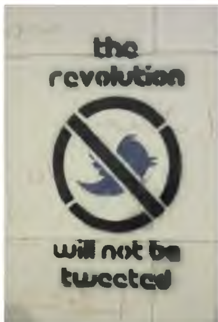
Transporter piechoty pokryty graffiti 21 oraz szablon na murze w okolicach placu Tahrir 22

Fakt ten stanowi niepodważalny dowód ogromnej roli graffiti jako narzędzia przekazu w rękach młodych Arabów. Jest to zjawisko stosunkowo nowe na gruncie arabskim, a już na pewno dotychczas nie występowało ono w takiej formie. Ciekawy jest przypadek Egiptu i Tunezji – tam pierwsze przykłady graffiti dotyczyły sportu. Kibice piłkarscy malowali na ścianach nazwy ulubionych klubów lub umieszczali obelgi pod adresem drużyn konkurencyjnych. Do dziś zresztą, pomimo pojawienia się na murach hasel politycznych i społecznych, motywy sportowe są obecne na murach arabskich miast i stanowią istotny odsetek całego zjawiska. Ten rodzaj graffiti w świetle przedstawionej wcześniej klasyfikacji jest jednak bezwartościowy z punktu widzenia świadomego artysty lub znawcy sztuki – nie niesie bowiem żadnego przesłania, które mogłoby dotrzeć do postronnego widza. Dopiero silne poruszenie społeczne przyniosło błyskawiczną metamorfozę arabskiego graffiti.