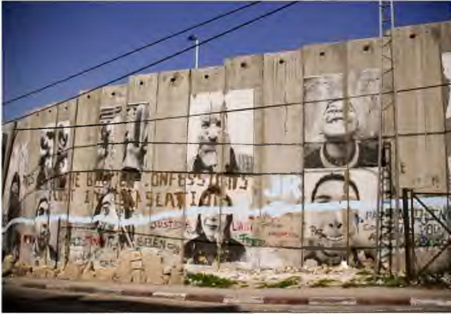
Street art na murze na granicy palestyńsko-izraelskiej

Wydarzenia w 2011 r. przyniosły największy do tej pory rozkwit sztuki ulicznej na Bliskim Wschodzie. Dzieła na murach i kreatywne transparenty pojawiały się równie szybko, jak przybywało ludzi na placu Tahrir w Kairze w trakcie demonstracji antyrządowych. Rosnące napięcie wśród obywateli krajów arabskich prowadziło do spontanicznych protestów i wyrazu niezadowolenia ludności Tunezji, Egiptu czy Libii. Przez kraje Bliskiego Wschodu przetoczyła się fala manifestacji, z których wiele miało dużo poważniejsze skutki niż wstępne założenia. Początkowo wszystkie wydarzenia miały charakter nieposłuszeństwa społecznego, ludzie wylegali na największe place i ulice miast domagając się zmiany rządów w poszczególnych państwach. Protesty te były tak silne, że doprowadziły do regularnych starć z siłami rządowymi, wojskiem i policją, a co za tym idzie, do licznych ofiar śmiertelnych. Sytuacja przypominała samonakręcającą się spiralę. Im większy był sprzeciw władzy wobec żądań społeczeństwa, tym ostrzejsze przejawy buntu. W samym tylko Egipcie w trakcie trwających trzy tygodnie masowych protestów, które doprowadziły do obalenia prezydenta Husniego Mubaraka, zginęło co najmniej 846 osób.