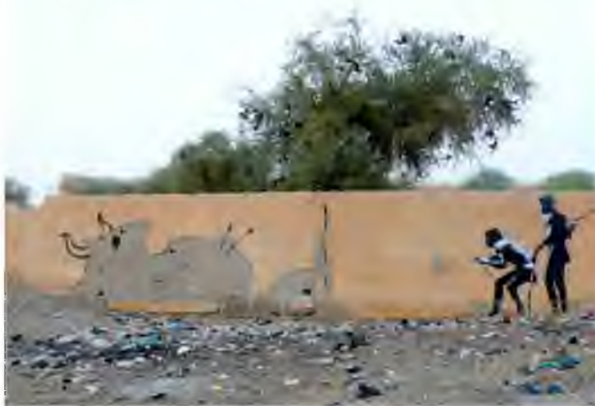
Szablon z Indii wraz z kręgu kultury afrykańskiej 16

Jak widać, street art jako dziedzina sztuki na świecie różnicuje się nie tylko ze względu na zawierane w nim motywy kulturowe, ale również stosowaną technikę i stopień skomplikowania prac – co również ma związek z postrzeganiem pojęcia estetyki w różnych kulturach.