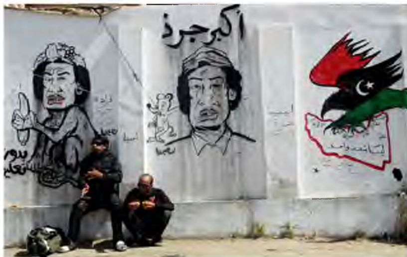
Karykatury Muammara Kaddafiego na murze w Libii 28

Ciekawym przykładem tego typu sytuacji mogą być również pojawiające się na murach libijskich miast karykatury Muammara Kaddafiego. Początkowo pojawiały się sporadycznie, ale z biegiem czasu stały się niemal zjawiskiem masowym. Libijczycy sfrustrowani sytuacją w państwie wyrażali swój nastrój w sposób najprostszy w odbiorze. Satyryczne ukazanie dyktatora było niezwykle skuteczną metodą rozpowszechniania nie tylko postawy społeczeństwa wobec samego Kaddafiego, ale również – poprzez ukazywanie go w różnych sytuacjach – krytyki prowadzonej polityki.