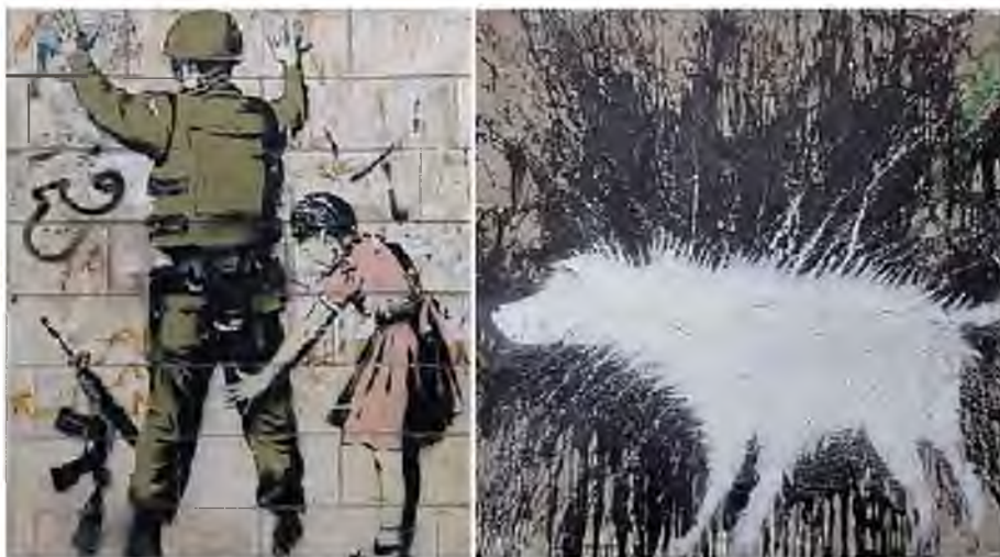
„Stop & Search” i „Wet dog”

Wyróżniającą i chyba najważniejszą cechą najciekawszych działań graffiti jest zaangażowanie, które staje się bodźcem ekspresji artystycznej i politycznej.