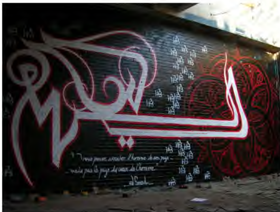
Graffiti inspirowane tradycyjną kaligrafią z elementami arabski – klasycznej formy zdobniczej Bliskiego Wschodu 18

Z definicji street artu wynika, że jest on częścią dyskursu społecznego, występującego w przestrzeni miejskiej. Bliski Wschód, od lat targany problemami wewnętrznymi i zewnętrznymi na tle politycznym, etnicznym czy społecznym, są doskonałym źródłem inspiracji dla artystów. Dlatego wiele prac tego nurtu zwraca uwagę na ważne problemy społeczne. Zjawisko to doskonale obrazuje ilość prac na murze stanowiącym linię demarkacyjną pomiędzy Izraelem a terytorium Palestyny, który stał się symbolem trwającego od lat 40. XX w. konfliktu palestyńsko-izraelskiego. Początków zaangażowania społeczno-politycznego street artu na Bliskim Wschodzie Julie Peteet 19 dopatruje się jednak w pierwszej intifadzie z przełomu lat 80. i 90., kiedy na ulicach palestyńskich miast pojawiać się zaczęły pierwsze antywojenne hasła. Mur traktować można jako ogromną powierzchnię wystawienniczą, umieszczoną nie tylko w przestrzeni publicznej, ale również w centrum konfliktu. Pierwszym artystą spoza świata arabskiego, który zdecydował się umieścić tam swoje dzieło był wspomniany wcześniej Banksy. Jego dzieła