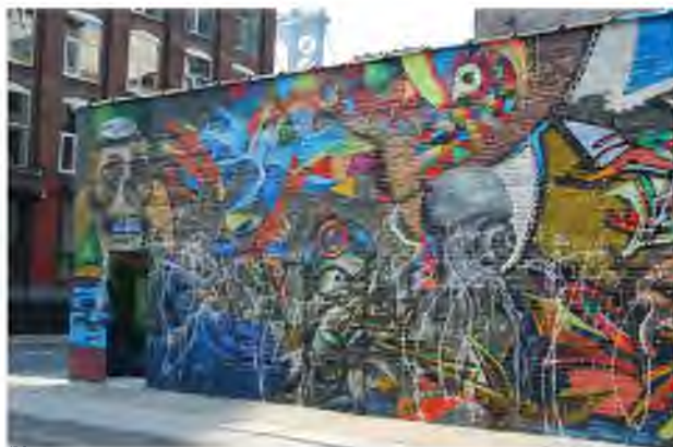
Graffiti z Japonii oraz mural w Brooklynie, USA 15