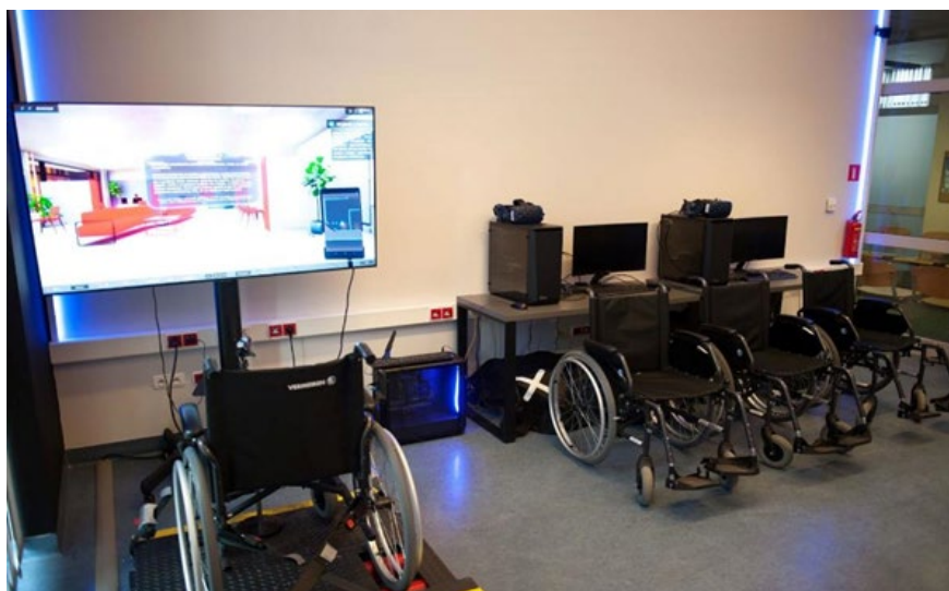
Fotografia 3. Laboratorium projektowania uniwersalnego – symulator jazdy na wózku inwalidzkim