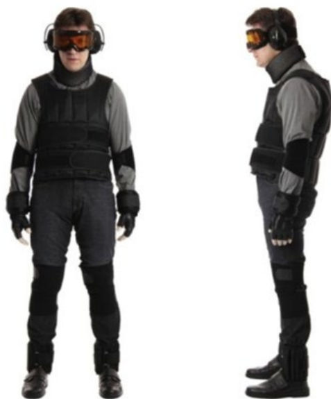
Fotografia 1. Symulator starości GERT