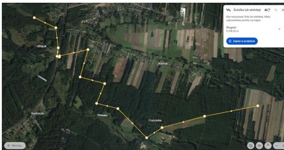
Mapa 3. Szlak transportu zrzutu z placówki „Buk” nieopodal Kocierzów do lasu majątku Pytowice