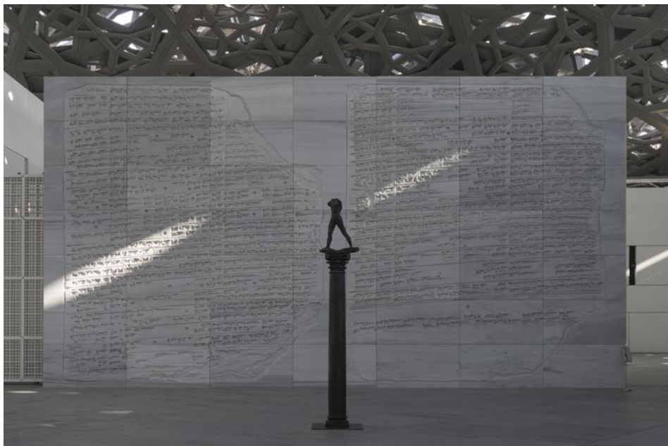
Ilustracja 4. Na ścianach zewnętrznych jednej z sal wystawowych zamontowano stałe instalacje przestrzenną For Louvre Abu Dhabi autorstwa amerykańskiej artystki Jenny Holzer.