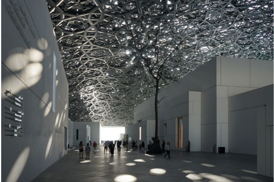
Ilustracja 5. Efekt filtrowania światła naturalnego przez wielowarstwową stalową kopułę wieńczącą muzeum.

ziemią na wysokości niemal 40 m i podparta jedynie w czterech punktach. Zadażenie składa się z 9 warstw wykonanych z aż 4 mln elementów z aluminium oraz stali 29 . Perforacje w kopule tworzą 7850 „gwiazd”, przez które do wnętrza muzeum wpadają pojedyncze „przefiltrowane” przez metalową strukturę promienie słoneczne. Tworzy to niezwykle widowiskowy efekt, określany przez Nouvela mianem „deszczu światła” 30 .