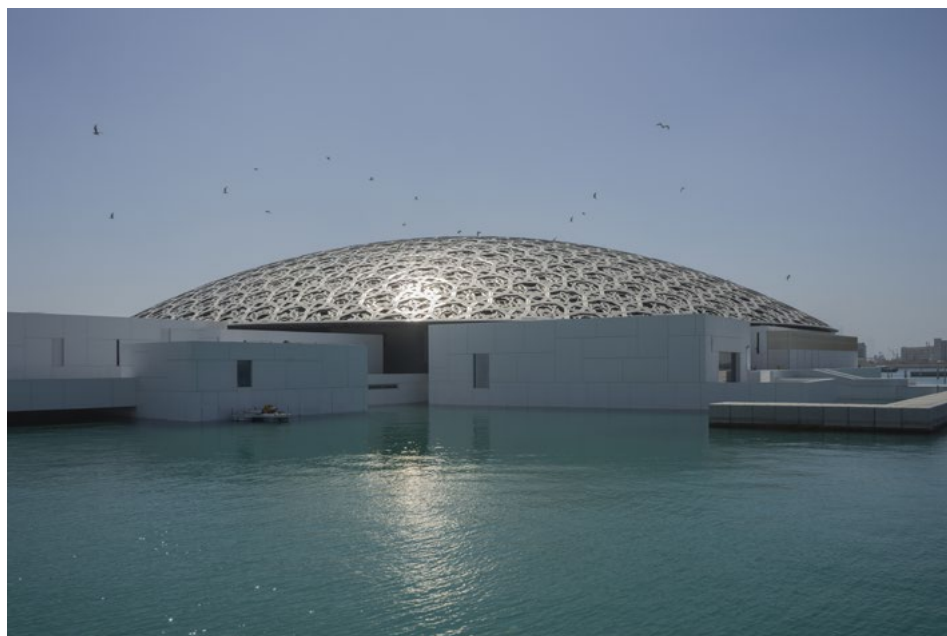
Ilustracja 1. Luwr w Abu Zabi widoczny od strony Zatoki Perskiej.

Muzeum Narodowe tego kraju (2003–2019) 16 , a w Arabii Saudyjskiej, na pustyni Al-'Ula budowany jest obecnie kompleks wypoczynkowy Sharaan Desert Resort (2017–?). Każdy z wymienionych projektów nosi cechy architektury „ikonicznej”, spektakularnej, innowacyjnej i eksperymentalnej, wpisując się trwale w najnowszą historię tej dyscypliny. To zapewne jeden z wielu powodów, dla którego to właśnie Nouvelowi w 2006 r. władze Abu Zabi powierzyły zadanie zaprojektowania nowego Luwru. Po trzech latach planowania budowę obiektu rozpoczęto 26 maja 2009 r., a oficjalna inauguracja działalności muzeum miała miejsce 11 listopada 2017 r. 17