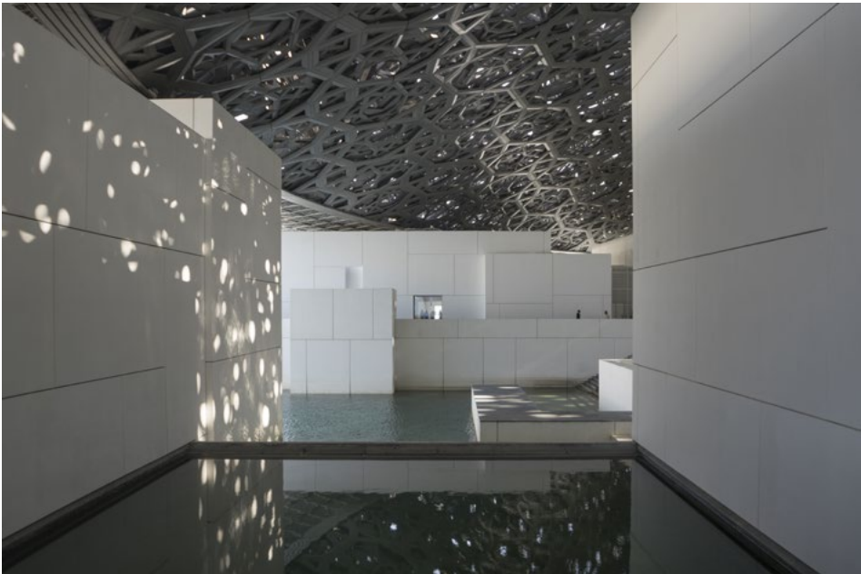
Ilustracja 3. Sale ekspozycyjne zlokalizowano wokół wewnętrznych dziedzińców otwartych na otaczającą muzeum wodę.

otaczające patia czy zbiorniki wodne. Galerie wystawowe można uznać za udane połączenie minimalistycznego designu z historycznymi eksponatami, lecz najbardziej widowiskowym elementem wnętrza muzeum jest tzw. plaza, do jakiej trafiamy tuż po wyjściu z ostatniej sali. Rozległy zadaszony plac uzupełniają płytkie sadzawki z niewielkimi wysepkami na pojedyncze eksponaty (il. 3); na drugim planie widać zatokę, zabudowania portowe, a w oddali panoramę miasta z coraz liczniejszymi drapaczami chmur (wśród nich znajduje się najwyższy wieżowiec w Abu Zabi – Burj Mohammed Bin Rashid Tower o wysokości 381 m autorstwa pracowni Foster + Partners). W tej otwartej przestrzeni pomiędzy salami wystawowymi kontrast błękitnej wody i białych ścian sal wystawowych może przywołać na myśl wcześniejszą realizację Nouvela – kompleks basenów we francuskim Hawrze (2004–2008) 26 . Wewnętrzny dziedziniec jest również miejscem prezentacji kilku szczególnych eksponatów – posągu The Walking Man, On a Column Auguste’a Rodina z 1900 r. oraz dwóch współczesnych instalacji site-specific autorstwa Jenny Holzer 27 (il. 4) i Giuseppe Penone 28 , stworzonych specjalnie na potrzeby arabskiego Luwru w 2017 r.