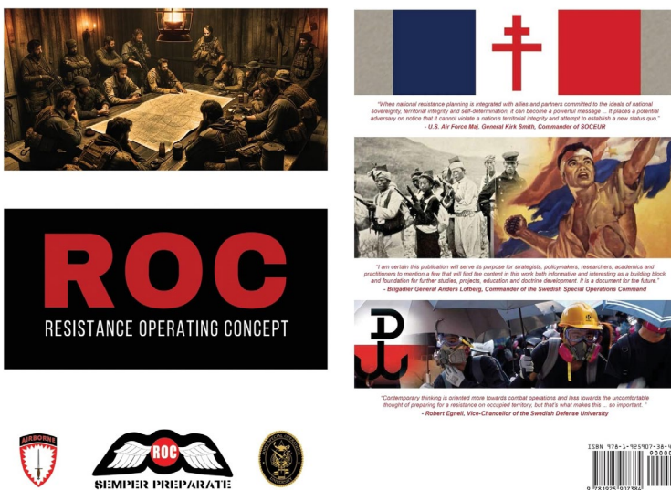
Zdjęcie 7. Okładka Resistance Operating Concept