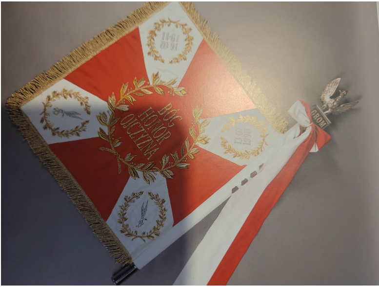
Zdjęcie 3. Sztandar GROM, na niej m.in. gapa cichociemnych i gapa GROM

Źródło: Tobie Ojczyzno..., op. cit., s. 320.