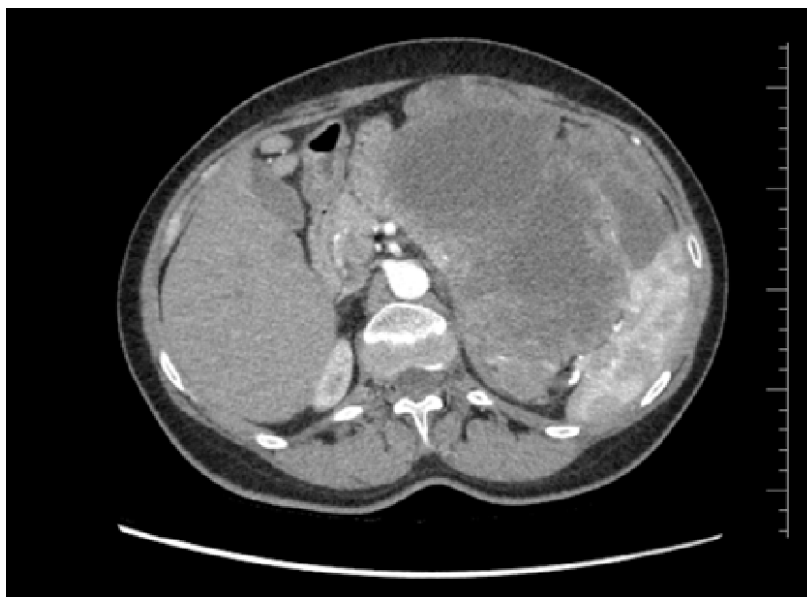
Rycina 1. Olbrzymi 25 cm guz w TK wykryty u jednego z pacjentów