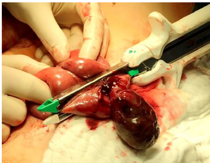
Rycina 2. Resekcja guza jelita cienkiego, średnicy ok. 10 cm, wykonana u jednego z pacjentów