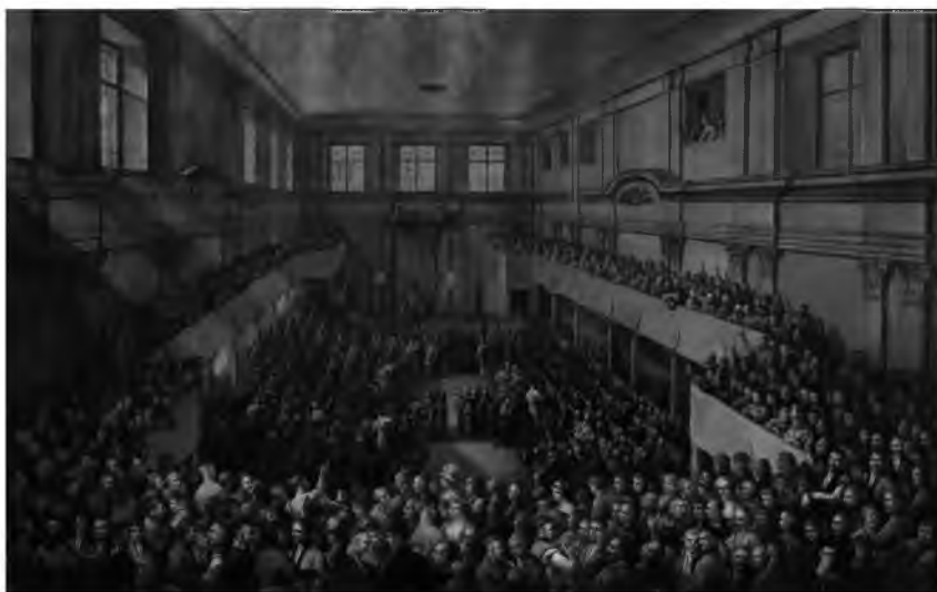
Fot. 14. Wojniakowski Kazimierz, Uchwalenie Konstytucji 3 maja