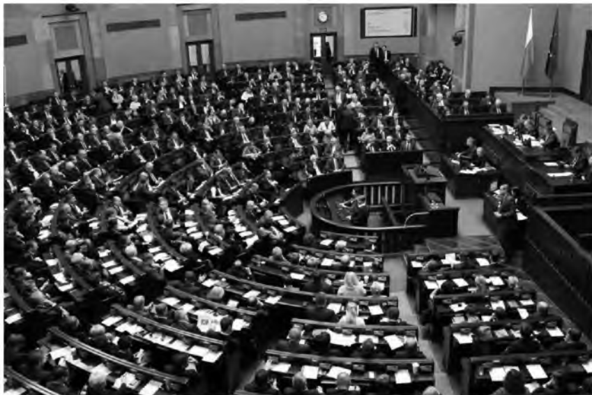
Fot. 2. Posiedzenie Sejmu

Źródło: oficjalna strona Sejmu. Zakończyło się 31. posiedzenie Sejmu, http://www.sejm.gov.pl/sejm8.nsf/komunikat.xsp?documentId=F45809E96F3D12A7C125807D0054AD36 [dostęp: 9.10.2018 r.].