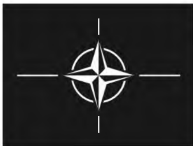
Fot. 22. Flaga NATO