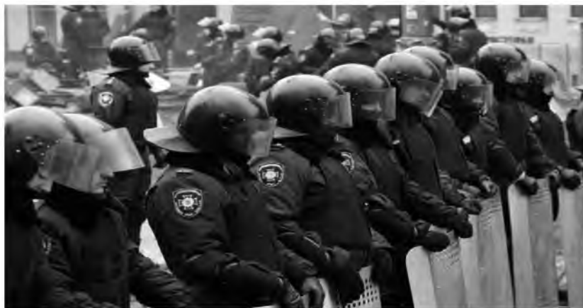
Fot. 16. Stan wyjątkowy w Ukrainie