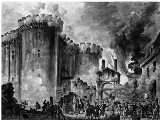
Fot. 13. Szturm na Bastylię – 14 lipca 1789 r.

Źródło: The Storming of the Bastille , Visible in the center is the arrest of Bernard René Jordan, m de Launay (1740–1789), https://pl.wikipedia.org/wiki/Plik:Prise_de_la_Bastille.jpg [dostęp: 9.10.2018 r.].