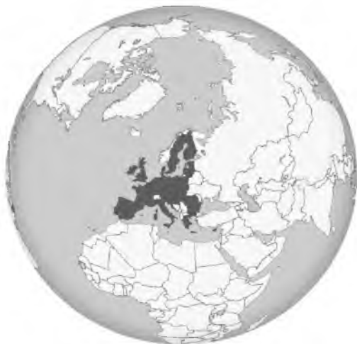
Fot. 24. Obszar Unii Europejskiej