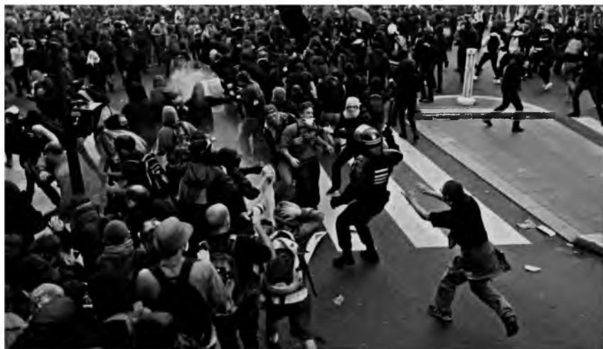
Fot. 5. Walki uliczne