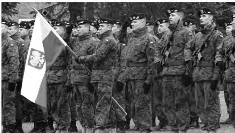
Fot. 11. Kolejni żołnierze wyjeżdżają na misję