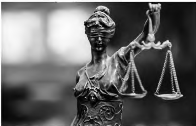
Fot. 1. Temida Bogini sprawiedliwości