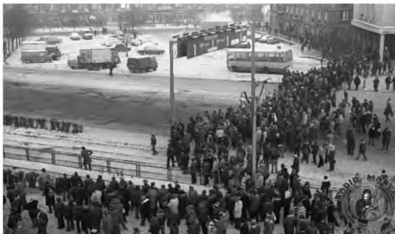
Fot. 17. 35 rocznica wprowadzenia stanu wojennego