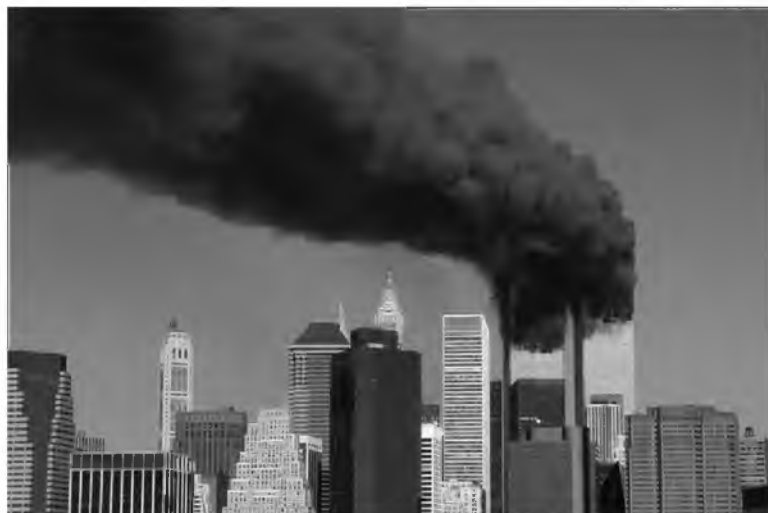
Fot. 9. Zamachy na WTC z 11.09.2001 r.

Źródło: 11 września roku pamiętnego... , „Newsweek Polska”, http://www.newsweek.pl/swiat/11-wrzesnia-roku-pamietnego---95914,1,1.html [dostęp: 9.10.2018 r.].