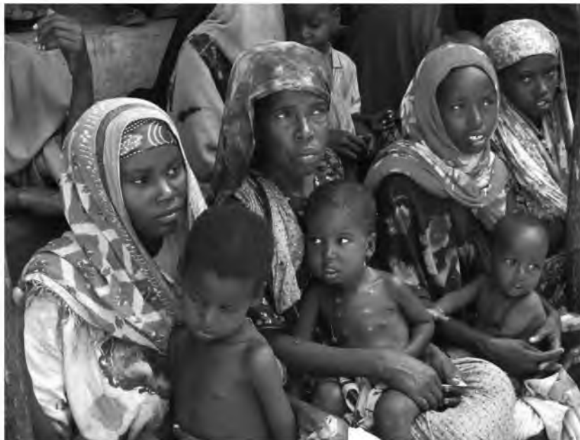
Fot. 6. W Afryce głoduje 13 milionów ludzi