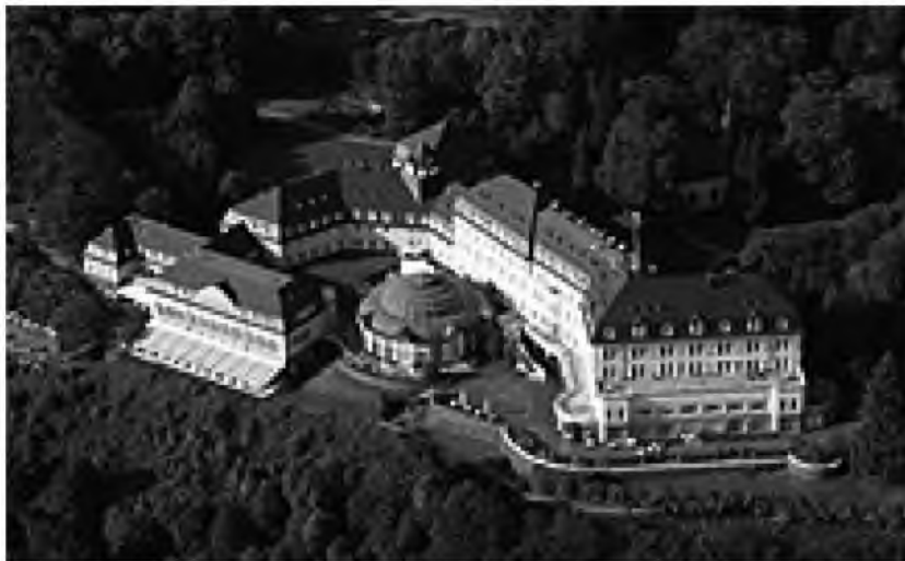
Fot. 27. Hotel Petersberg