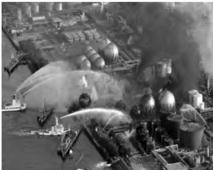
Fot. 8. Katastrofa elektrowni jądrowej Fukushima I w 2011 r.