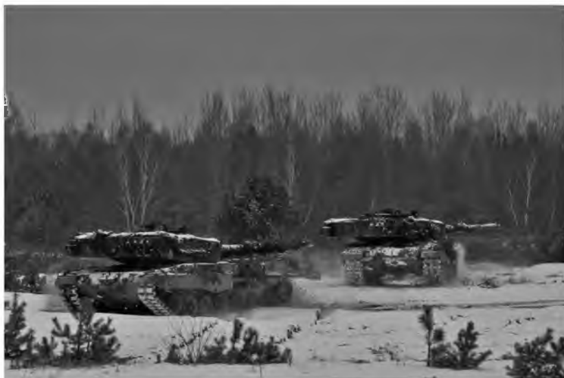
Fot. 18. Czołgi atakujące stanowisko wroga