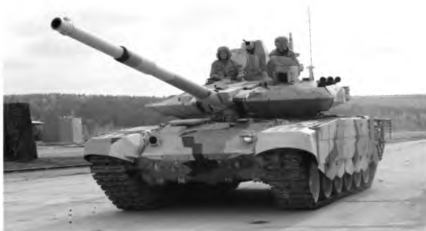
Fot. 15. Czołg