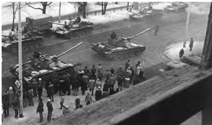
Fot. 19. Ofiary stanu wojennego