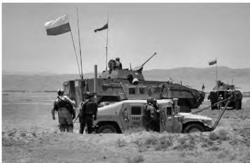
Fot. 29. Konwój z Polskiej Grupy Bojowej