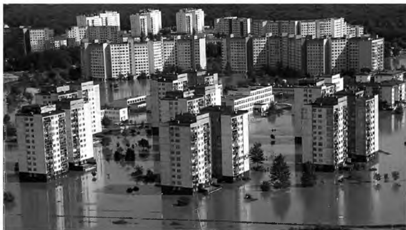
Fot. 7. Powódź w mieście Wrocław