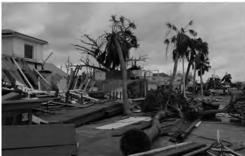
Fot. 20. Huragan „Irma” na Florydzie w 2017 r.