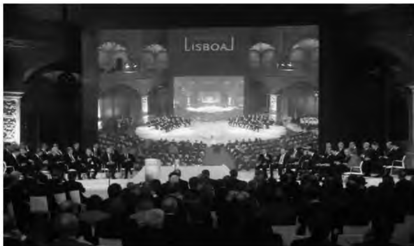
Fot. 28. Uroczystość podpisania Traktatu Lizbońskiego