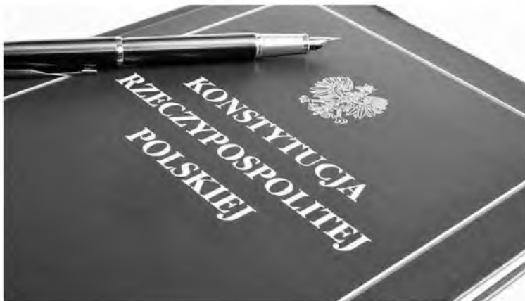
Fot. 3. Konstytucja RP