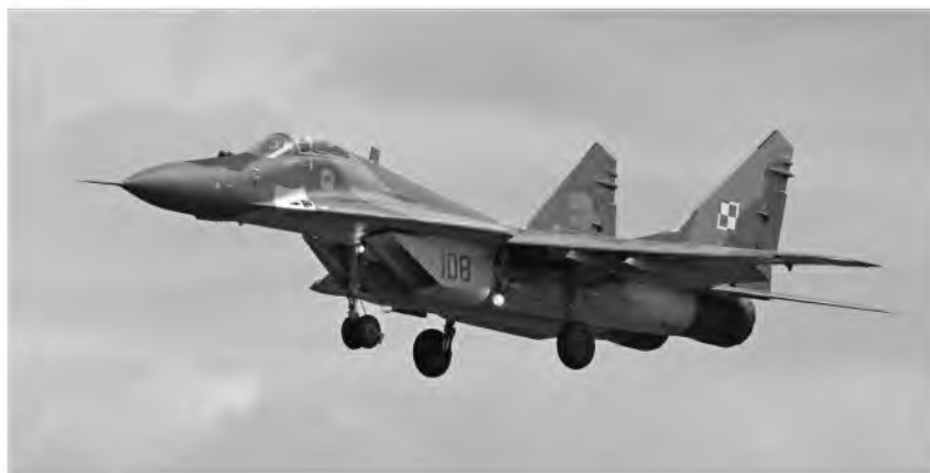
Fot. 4. Mig 29