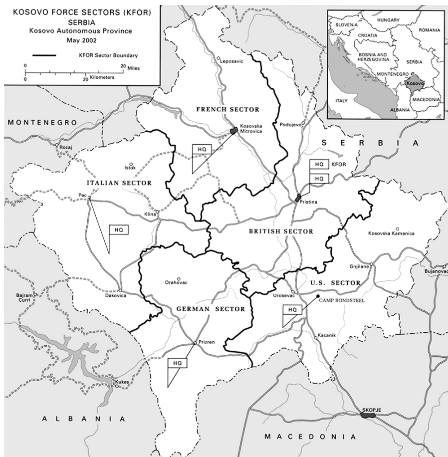
Mapa 1. Podział Kosowa na sektory kontrolowane przez siły KFOR