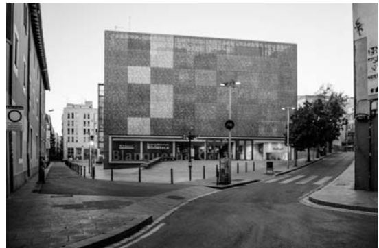
Il. 10. Jedną z pierzei placu tworzy nowy budynek biblioteki uniwersyteckiej. Kolejny przykład na zgodną koegzystencję nowoczesnej architektury w zabytkowym środowisku. Skojarzenie funkcji placu miejskiego, miejsca dla aktywności fizycznej oraz biblioteki jest znakomitym zabiegiem dla ożywiania życia społecznego w mieście. Przestrzeń ta jest areną przecinania się codziennych ścieżek różnych grup użytkowników i wytwarzania się interakcji będących esencją życia miejskiego, 2017 r.