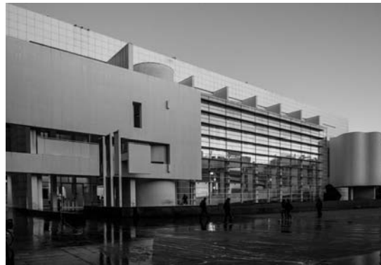
Il. 6. Muzeum Sztuki Współczesnej, proj. Richard Meier. Przykład wprowadzenia do zabytkowego centrum zarówno nowej funkcji, jak i formy architektonicznej. Wraz z dawnym klasztorem na ilustracji obok stanowią ściany ważnego społecznie i kulturowo placu, 2017 r.