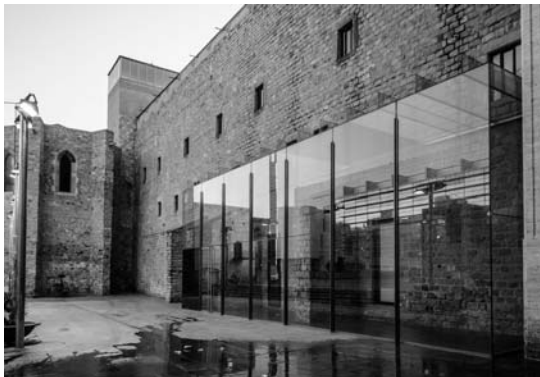
Il. 5. Zabytkowy budynek dawnego klasztoru przekształcony na centrum kultury, galerię i bibliotekę (MACBA Study Centre). Tworzy jedną z pierzei Placu Aniołów, 2017 r.; fot. autor