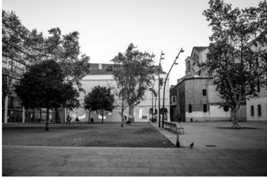
Il. 7. Plaça de Joan Coromines to kolejny z zespołu placów miejskich tworzących spójną, zróżnicowaną i atrakcyjną przestrzeń publiczną. Znajduje się na tyłach Muzeum Sztuki Współczesnej a jednocześnie przed wejściem do innej ważnej instytucji kulturalnej i kulturotwórczej – Centrum Kultury Współczesnej (Centre de Cultura Contemporània de Barcelona), zlokalizowanej w poddanych modernizacji zabytkowych budynkach, 2017 r.