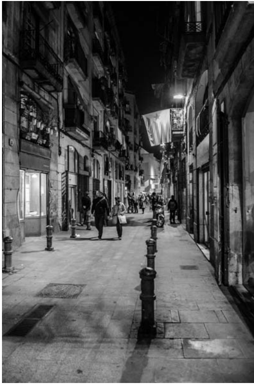
Il. 2. Charakterystyczny krajobraz miejskich uliczek El Raval. Ludzka skala przestrzeni. Mieszkalne kamienice z lokalami usługowymi w partarach. Ruch pieszy, 2017 r.