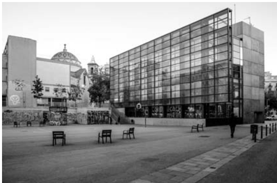
Il. 9. Plaça de Terenci Moix to przykład kompletności funkcjonalnej w przestrzeni publicznej. Plac ten, mimo iż zlokalizowany jest w ścisłym centrum miasta, poza typowymi urządzeniami dla takich miejsc, mieści w swej nawierzchni boisko sportowe oraz ścianę do wykorzystania przez młodzież jako miejsce artystycznej ekspresji. Nową ścianą wnętrza jest nowoczesna, przeszklona elewacja biblioteki uniwersyteckiej, 2017 r.; fot. autor