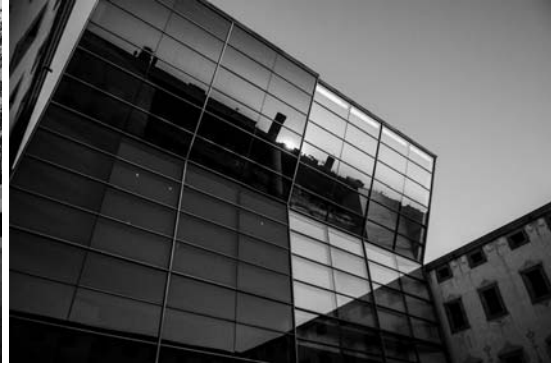
Il. 8. Centre de Cultura Contemporània de Barcelona. Dodana do zabytkowych kamienic szklana elewacja, za którą pomieszczono foyer i komunikację pionową. Odchylenie ściany od pionu daje znakomity efekt w postaci lustrzanego odbicia i możliwości kontaktu wzrokowego z portem. Przykład na wzmacnianie tożsamości poprzez architekturę, 2017 r.