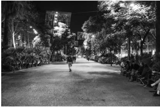
Il. 11. Rambla del Raval – nowa aleja spacerowa i wyraźny sygnał przywiązania do lokalnej tradycji komponowania przestrzeni publicznych w ten sposób. Ta skryta w cieniu palm przestrzeń publiczna jest często wykorzystywana do organizacji lokalnych targów, festiwali kulinarnych itp., 2017 r.