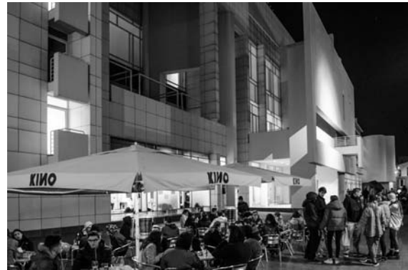
Il. 3, 4. Plac Aniołów otoczony obiektami o funkcjach kulturalnych stanowi naturalne poszerzenie ich przestrzeni i jest miejscem interakcji: mieszkańcy–turyści–sztuka–zabawa itd., 2017 r.