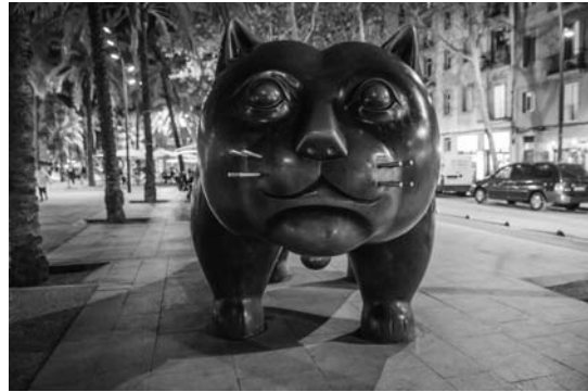
Il. 12. Kot z Raval (El Gato de Botero) . Rzeźba z brązu autorstwa Fernando Botero przedstawiająca sympatycznego lekko opasłego kota, stała się popularnym miejscem odwiedzin przez turystów. Dla mieszkańców to ważny punkt orientacyjny w mieście. Ta uliczna rzeźba pełni rolę wyróżnika miejsca i określa jego tożsamość, 2017 r.